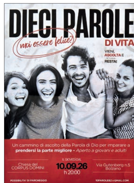
Il manifesto che annuncia l'iniziativa da inizio settembre a Bolzano

Nella nostra diocesi l'iniziativa è stata presentata al convegno pastorale a Bressanone e nella visita pastorale cittadina del vescovo. E anche a Bolzano, nelle passate edizioni, i partecipanti sono stati decine: espressione di parrocchie, movimenti e anche persone fuori dalla chiesa. Tutti mossi dalla voglia di sentirsi uniti, di non vedersi separati, di gustare la ricchezza della relazione, dei legami che vanno oltre l'appartenenza alle singole parrocchie. Insomma, persone che hanno voglia di donare frutti a tutti. Nell'incontro si parte dalla Parola di Dio incarnata, si punta sull'ascolto, sulla testimonianza, sull'esperienza concreta che ha cambiato la persona. I Dieci comandamenti, da cui parte la riflessione, sono interpretati come "parole di vita" e non solo come divieti, come vie per vivere la relazione con Dio e trovare la vera