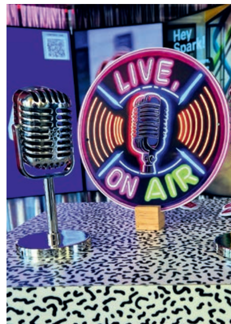
Tante le novità estive per il pubblico della radio dai microfoni di RSF-inBlu