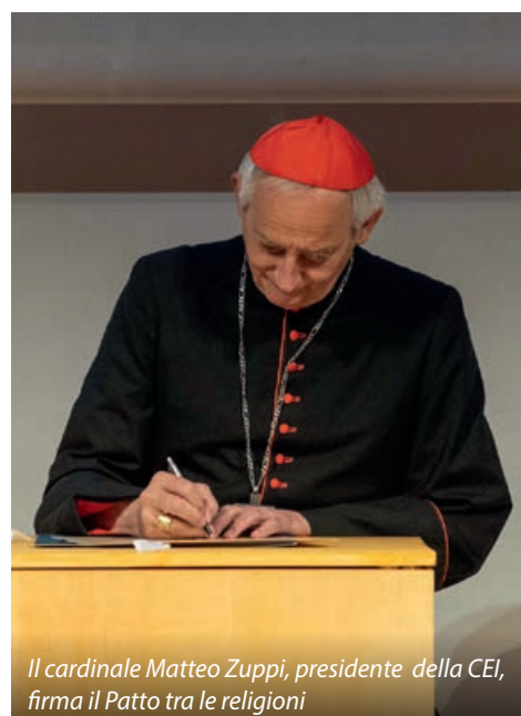
Il cardinale Matteo Zuppi, presidente della CEI, firma il Patto tra le religioni