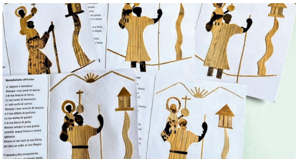
I biglietti realizzati dalle donne ugandesi con le foglie di banano