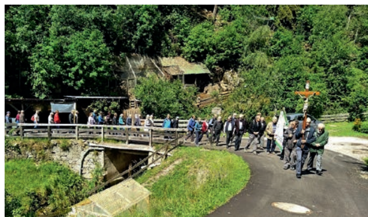
Il gruppo dei sacrestani e delle sacrestane della diocesi in pellegrinaggio sul Renon