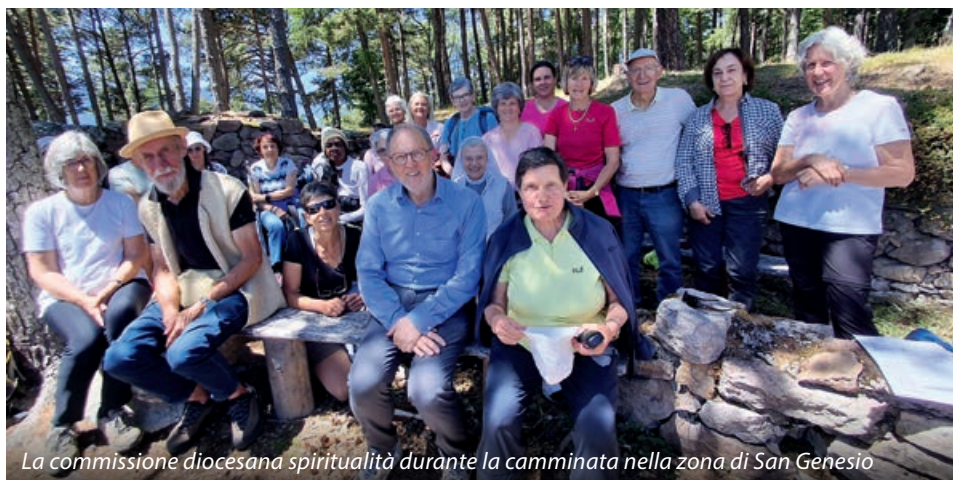
La commissione diocesana spiritualità durante la camminata nella zona di San Genesio

Dopo il pranzo, con il cibo portato da casa e condiviso con tutti, durante la discesa c'è stato spazio per lo scambio e per porsi la domanda: cosa porto con me nel mio quotidiano? Sicuramente, per la maggior parte dei partecipanti, si tratta della gratitudine per il percorso compiuto insieme, nonché della celebrazione della fede in comunione con il gruppo.