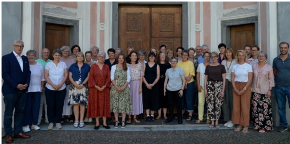
Foto di gruppo a Bressanone per le nuove guide della celebrazione della Parola

La diocesi può contare oggi su ulteriori 33 guide della celebrazione della Parola, tra cui 29 donne. Provenienti da tutta la diocesi, a giugno hanno ultimato la formazione e possono ora celebrare la Parola nelle comunità parrocchiali. Il corso in lingua italiana si conclude a novembre. Le celebrazioni della Parola sono ormai una parte