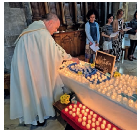
Il vescovo in duomo a Bolzano accende le candele per i maturandi

vicinanza, incoraggiamento e preghiera per studentesse e studenti alle prese con l'esame finale. Inoltre i maturandi hanno ricevuto sul cellulare un messaggio personale di benedizione da parte del vescovo. Anche amici, insegnanti, genitori, nonni, fratelli e sorelle hanno partecipato all'iniziativa "Be Blessed!". In duomo sono state poi recitate alcune preghiere di intercessione per i giovani. Il vescovo ha definito l'iniziativa un connubio tra vicinanza personale, preghiera e comunicazione moderna e ha augurato un esame di successo a tutti i maturandi delle scuole altoatesine.