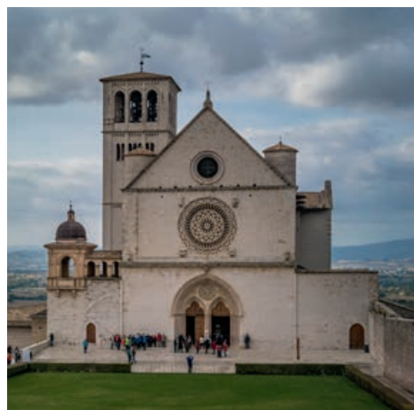
La basilica di Assisi custodisce la tomba di san Francesco