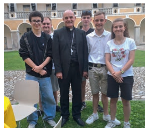
Il vescovo con i giovani volontari della Banca del cibo