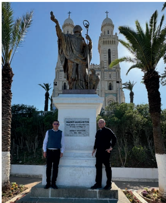
I due parroci altoatesini sotto al monumento del fondatore dell'ordine agostiniano

Dall'Alto Adige all'Algeria: due religiosi degli agostiniani di Novacella – il responsabile dell'unità pastorale di Chienes e il parroco di Fiè – in viaggio sulle tracce di sant'Agostino in concomitanza con la visita di papa Leone XIV.