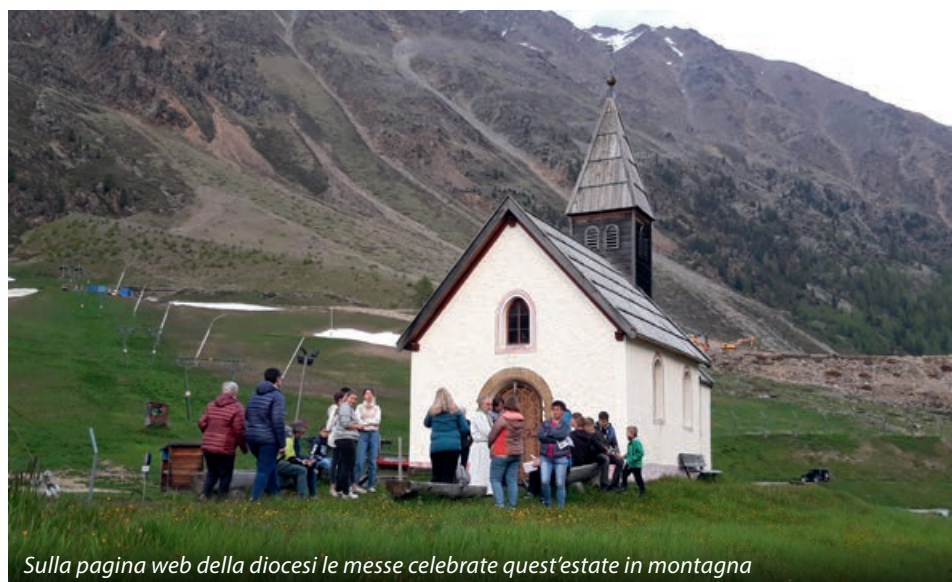
Sulla pagina web della diocesi le messe celebrate quest'estate in montagna

cinanza di Dio è palpabile e rende grati. Questi momenti di raccoglimento immersi nella natura uniscono fede, paesaggio e memoria, in un legame celebrato in alcune delle più suggestive cappelle in quota del territorio.