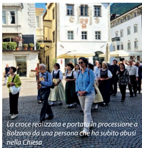
La croce realizzata e portata in processione a Bolzano da una persona che ha subito abusi nella Chiesa

N ella solennità del Corpus Domini il vescovo Ivo Muser ha presieduto nel duomo di Bolzano la celebrazione trilingue, accompagnata – come in tante parrocchie della diocesi – dalla tradizionale processione con l'ostia consacrata portata sotto un baldacchino ed esposta alla pubblica adorazione, rap-