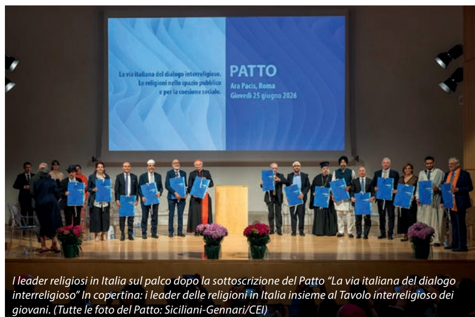
I leader religiosi in Italia sul palco dopo la sottoscrizione del Patto "La via italiana del dialogo interreligioso" In copertina: i leader delle religioni in Italia insieme al Tavolo interreligioso dei giovani.