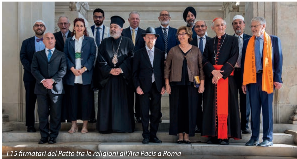
I 15 firmatari del Patto tra le religioni all'Ara Pacis a Roma

I rappresentanti delle comunità religiose in Italia sono stati poi ricevuti al Quirinale dal presidente della Repubblica Sergio Mattarella al quale hanno consegnato il documento sottoscritto per la prima volta nella storia dell'Italia. La firma è una tappa fondamentale di un percorso iniziato nel 2023: da allora i leader delle religioni diffuse nel Paese si sono incontrati annualmente nella sede della Conferenza episcopale ita-