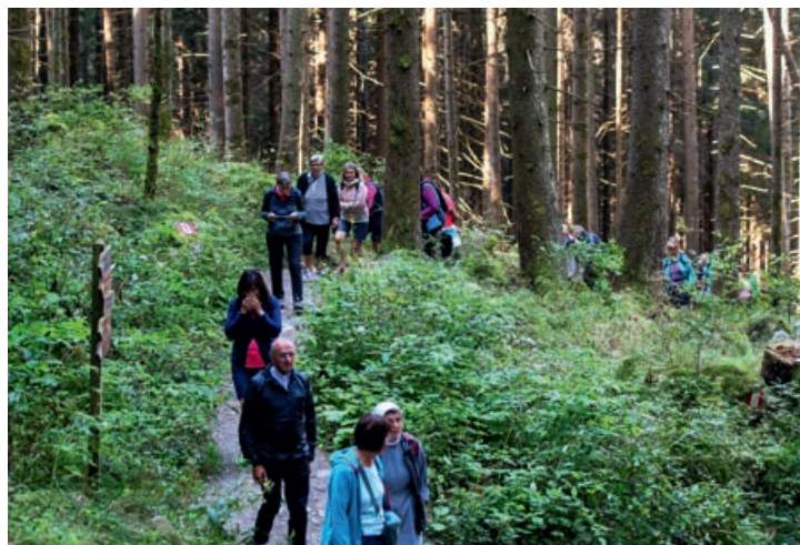
Uno dei più amati dagli escursionisti è il Sentiero di san Francesco a Campo Tures

Voglia di escursioni, natura, silenzio: con l'arrivo dell'estate si riscoprono gli itinerari di fede e i momenti di meditazione sui monti altoatesini. La Diocesi ripropone il vademecum dei sentieri spirituali in Alto Adige.