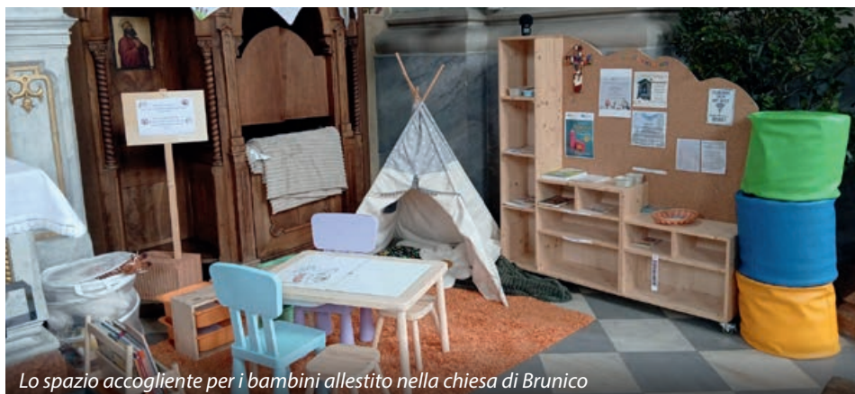
Lo spazio accogliente per i bambini allestito nella chiesa di Brunico