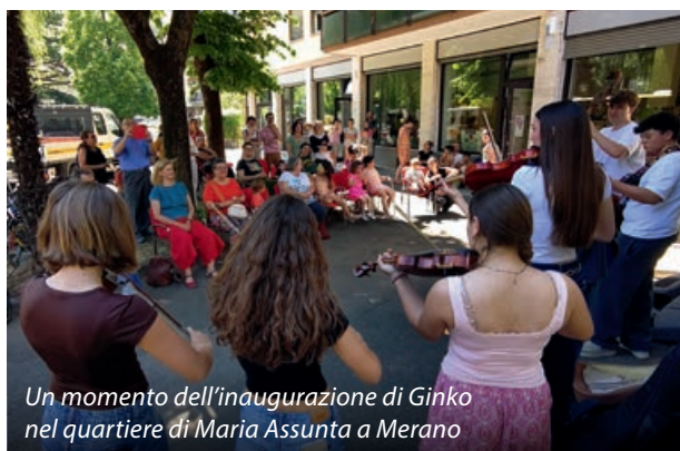
Un momento dell'inaugurazione di Ginko nel quartiere di Maria Assunta a Merano

Ginko intende perciò sensibilizzare sui temi della corretta alimentazione e della vita sana, delle sofferenze spes-