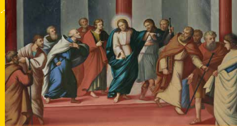
(Bildmotiv „Aussendung der Apostel“, Kirche zum hl. Petrus in Tschöfs – Sterzing)

Die glorreichen Geheimnisse (bedenken die fünf österlichen Glaubenswahrheiten) ...Jesus, der von den Toten auferstanden ist (Lk 24,6) ...Jesus, der in den Himmel aufgefahren ist (Apg 1,9-11) ...Jesus, der uns den Heiligen Geist gesandt hat (Apg 2,1-13) ...Jesus, der dich, o Jungfrau, in den Himmel aufgenommen hat (1Kor 15, 22-23) ...Jesus, der dich, o Jungfrau, im Himmel gekrönt hat (Offb 12,1)